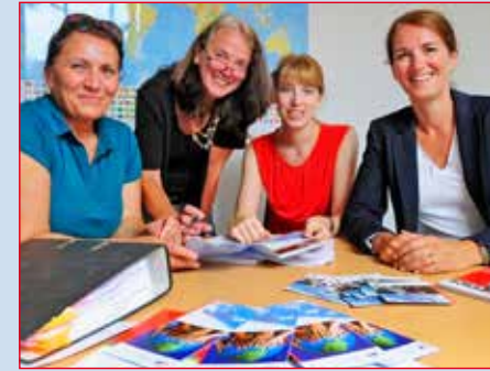
Das Team des PSZ und der Flüchtlingsberatung Moers.

Sie verfügen über gute Kenntnisse des Ausländer- und Sozialrechts. Supervision und regelmäßige Fortbildungen gehören zu unseren Standards, um den stets aktuellen Wissenstand zu garantieren.