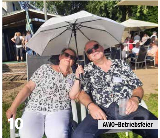
Glück auf, AWO-Kita Am Förderturm