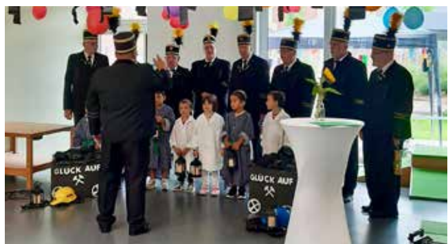
Foto unten: Der Männerchor „MGV Concordia des Bergwerks Lohberg 1916“ präsentiert mit Kita-Kindern das Steigerlied.