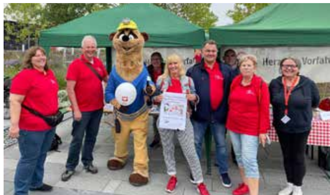
Bild unten: AWO-Aktive mit Maskottchen Kalli bei der letzten großen Engagement-Aktionsmeile 2021 in Kamp-Lintfort